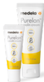
Crema de lanolina Purelan™