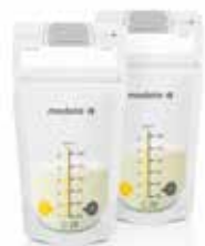
Bolsas de almacenamiento de leche materna

Te presentamos nuestros sujetadores supercómodos que te mantendrán fresca